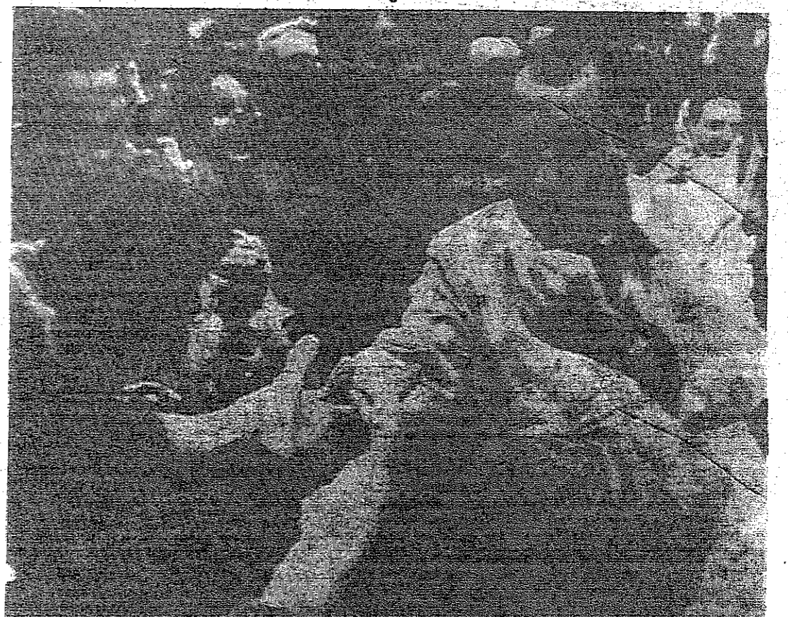
المستر رشاد نيكسون المرشح للرياسة الاميركية يصافح الجمهور الكبير الذي تنفق على مطار بيرسبرغ أمس لتحيته . وقد اكتمل استقيلته (كلاما وبشارة من يده) انه سيطرح بمناقسه الديمقراطي في الانتخابات «صورة لاسلكية»

واشنطن - د. ب. - استمر نسبة السباق التي حققها ريتشارد نيكسون المرشح الجمهوري لانتخابات الرياسة الاميركية على منافسه الديمقراطي هوبرت همفري في مواجهة الانتخابات التدرجية مع اقتراب موعد اجراء انتخابات الرياسة يوم تشرين الثاني (يوم الثلاثاء القادم) . واذا استمر هذا الاتجاه المتنازلي الذي لوحظ في الاسابيع الماضية يمكن توقع منافسة قريبة بين المرشحين الرئيسيين . ويقدم همفري استراتيجيته الان على أساس ان لديه فرصا حقيقية للحصول على نايد ثنائي ولايات بالاضافة الى واشنطن ويبلغ مجموع اصواتها ٢٥١ صوتا في المجموع الانتخابي . وهذه الاصوات ان اضفي همفري أغلبية ال ٢٧٠ صوتا المطلوبة للحصول على الرئاسة . ولكنه مستعزز فوز نيكسون وتترك اتخاذ قرار باللائحة لمجلس النواب الاميركي .